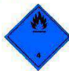
Вещества, выделяющие легковоспламеняющиеся газы при соприкосновении с водой