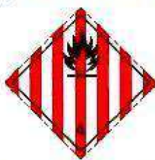
Легковоспламеняющиеся твердые вещества, самореактивные вещества и десенсибилизированные взрывчатые вещества