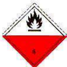
Вещества, способные к самовозгоранию