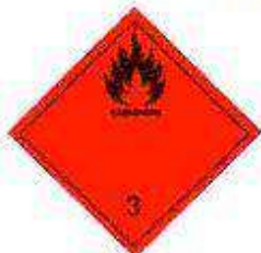
Легковоспламеняющиеся жидкие вещества