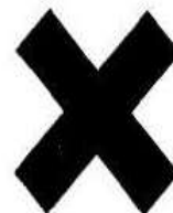
Вещество, опасное для здоровья